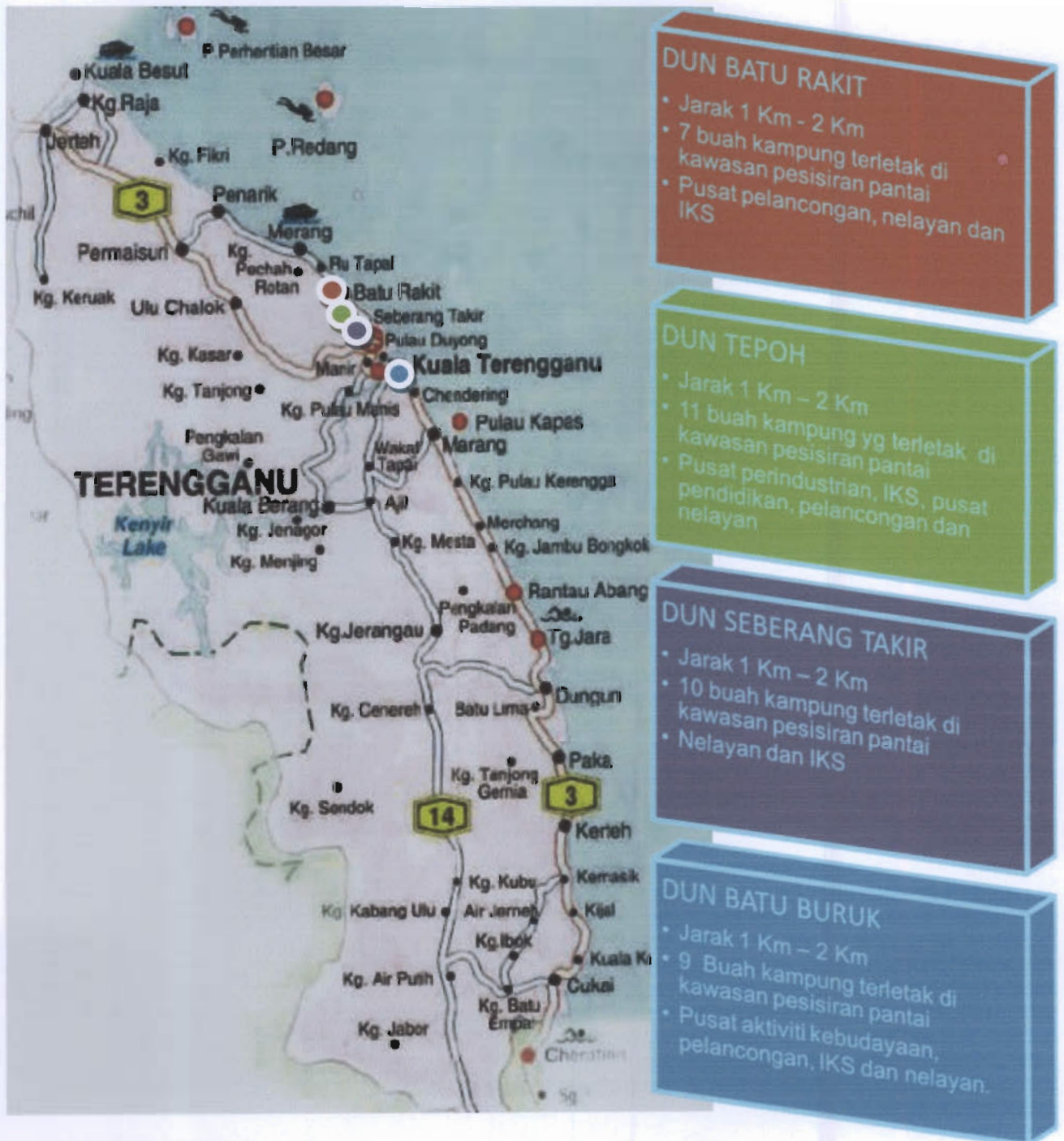
Rajah 2 : Peta kawasan kajian